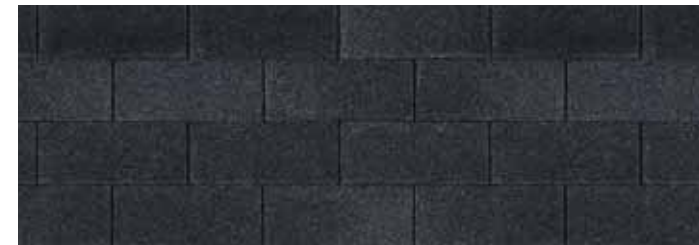
• Onyx Black