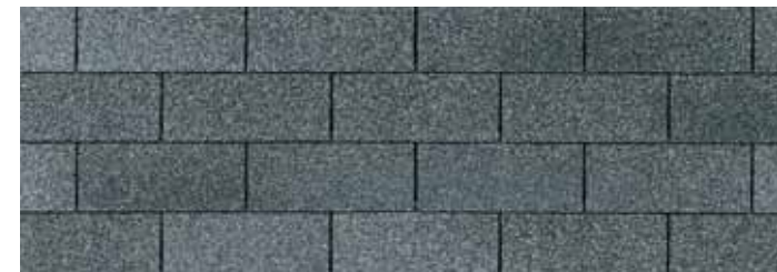
• Chapel Grey