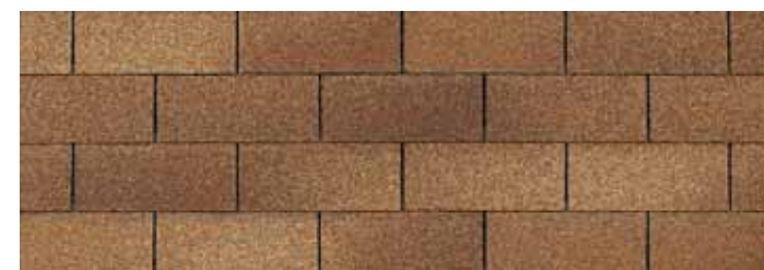
• Desert Tan