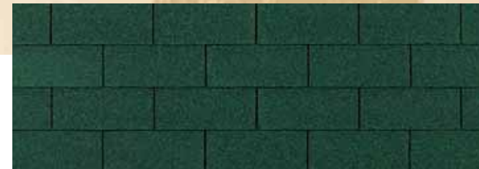
• Chateau Green

Подтверждено, что вся черепица Owens Corning соответствует или превосходит существующие стандарты пожаростойкости и ветростойкости.