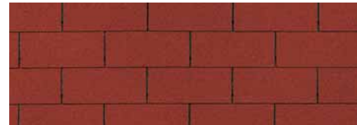
• Spanish Red